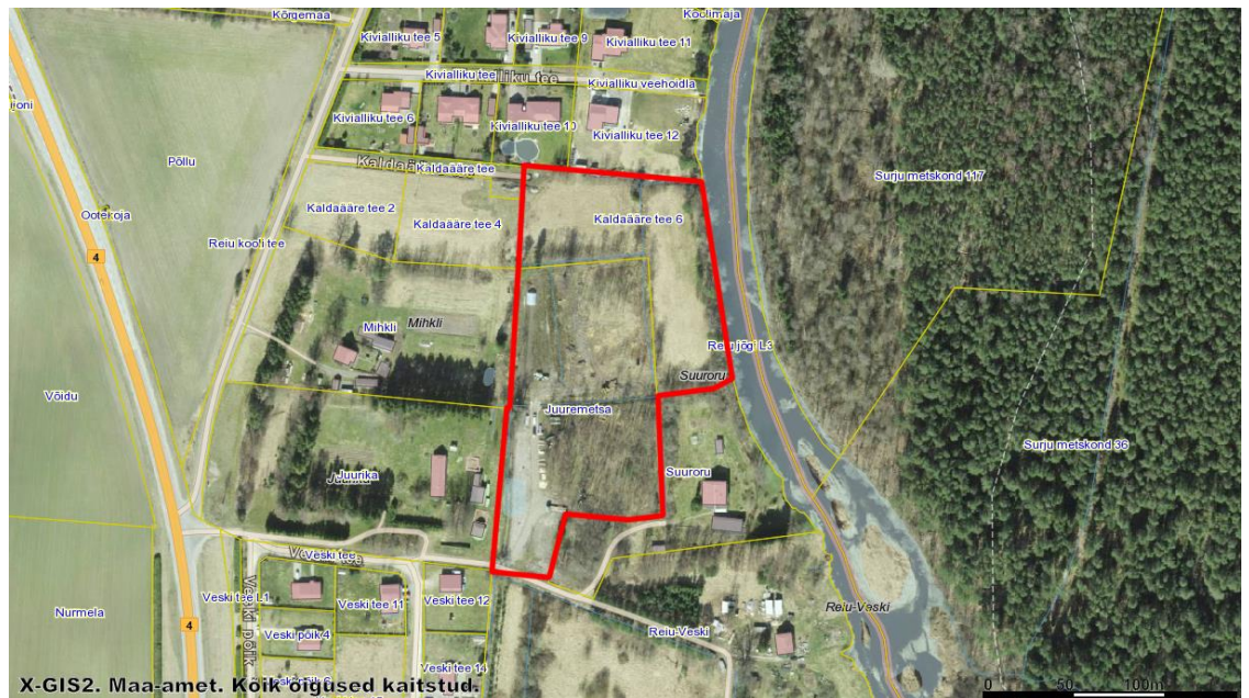
Joonis 1. Planeeringuala aerofoto, planeeringuala märgistatud punase joonega.

Maakasutus: Alal kehtivas Tahkuranna valla üldplaneeringus on kinnistud määratud elamuehituse reservmaa-alaks. Maa-ameti kaardiinfo kohaselt on Juuremetsa kinnistu 100% maatulundusmaa ja Kaldaääre tee 6 kinnistu 100% elumumaa. Mõlemad kinnistud on hoonestamata. Juuremetsa kinnistu on peamiselt metsamaa. Kaldaääre tee 6 kinnistu on peamiselt rohumaad, mis on olnud osaliselt haritav ning metsamaa (väheväärtuslikud lehtpuud).