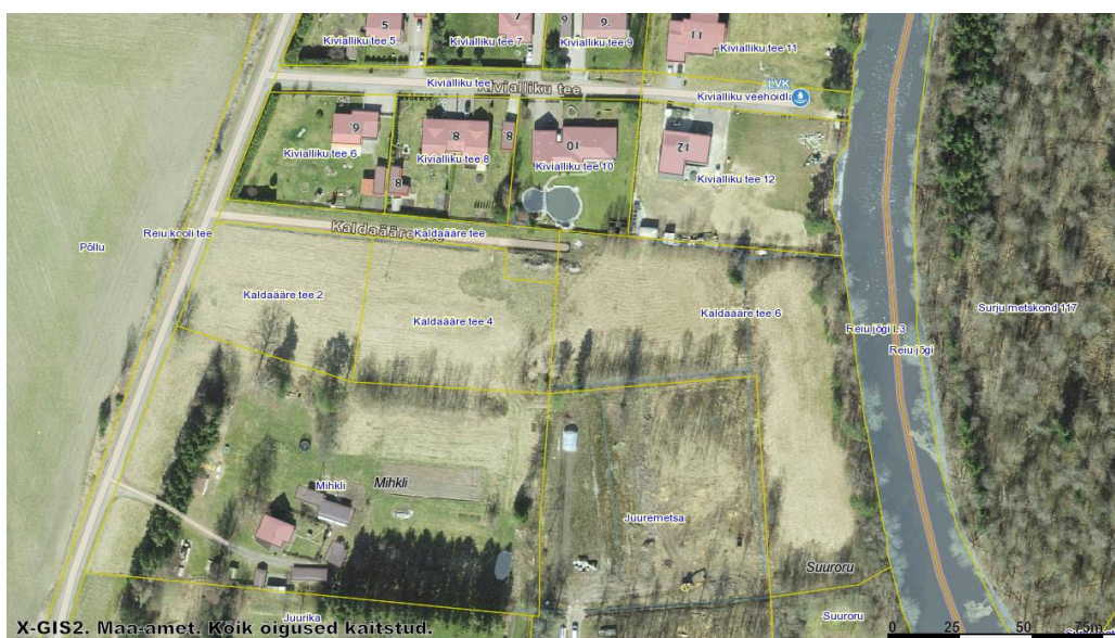
Joonis 3. Tuletõrje veevarustuse asukohaskeem. Veevõtukoht märgitud sinisega.

Nõuetekohane tuletõrje veevarustus on lahendatud hoonete sprinklersüsteemidega ja veevõtukohta LVK ID 4173 baasil (kaugus ca 350 m, vt. Joonis 3). Tagatud on tuletõrjevee vajalik vooluhulk 10 l/sek 3 h jooksul, mis teeb arvutuslikuks koguseks 108 m 3 . Juurdepääsuteede kandevõime 20t, pöörderaadiused 12m ja laiuses 3,5m. Tuletõrje veevõtukohtadele on tagatud aastaringne juurdepääs ning kasutamise valmidus ja tulekahju kustutamiseks vajalik veekogus või vooluhulk ning tähistatus vastavalt tehnilisele normile või õigusaktile. Tuletõrjeautodele on kavandatud überpööramisala 12x12m. Juuremetsa kinnistule ja überpööramisala on määrataud varasema detailplaneeringuga Kaldaääre teele